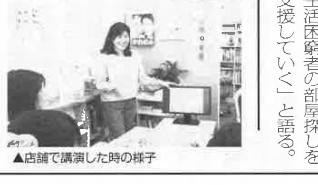
▲店舗で講演した時の様子

同社は2014年に高田寺本店で営業開始。来店客の増加と案内する物件のエリア拡大に伴い、18年には吉祥寺店をオープンした。