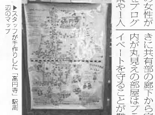
▼スタッフを作り出した「高田寺」駅周辺

同社は2014年に高田寺本店で営業開始。来店客の増加と案内する物件のエリア拡大に伴い、18年には吉祥寺店をオープンした。